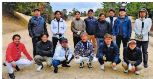
チャリティゴルフ大会