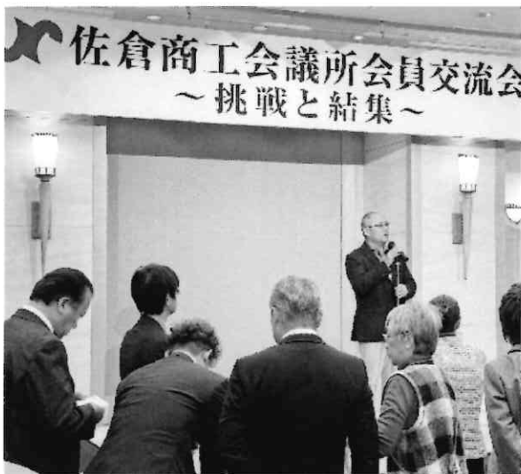
橋爪副委員長による開会の言葉