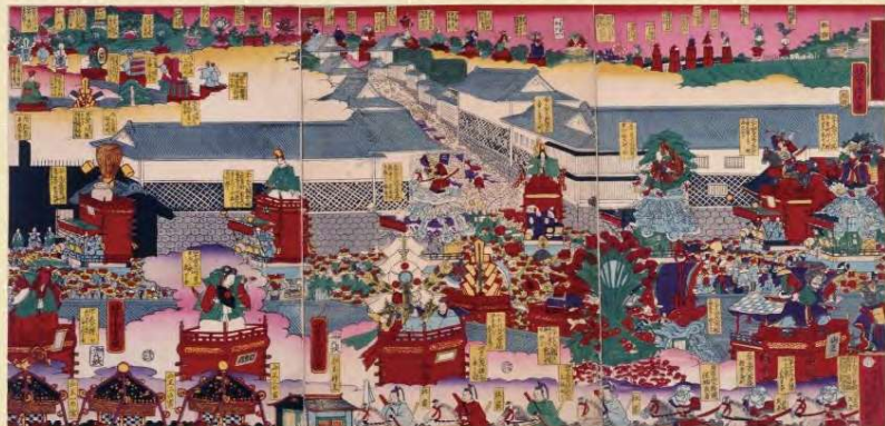
六月十五日山王御祭禮練込図 万延元年(1860)歌川芳虎/画 江戸東京博物館蔵

将軍のお膝元である江戸城内への練り込みが許されたこの祭りは、まさに「天下」の名にふさわしい豪華絢爛なものでした。画面を埋め尽くす見物人と、誇らしげに曳き回される煌びやかな人形山車が連なる光景からは、江戸っ子たちの心意気と祭りの喧騒が聞こえてくるようです。