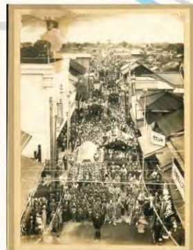
昭和11年 佐倉新町大祭の様子