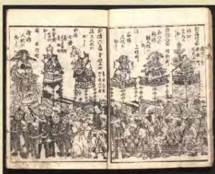
山王御祭禮版附 万延元年(1860)月豊原国周/画 江戸東京博物館蔵