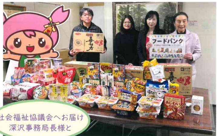
社会福祉協議会へお届け 深沢事務局長様と